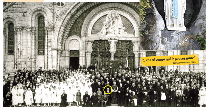
1934: foto storica del primo pellegrinaggio diocesano a Lourdes organizzato dalla Sezione Veneta dell'Unitali con San Leopoldo Mandić (in basso nel cerchio)